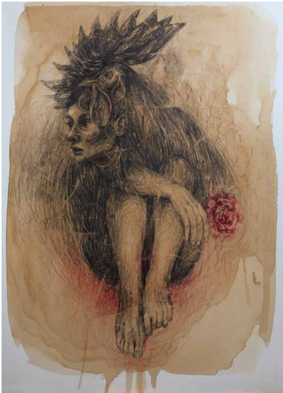
بدون عنوان | ۱۳۹۷ | ترکیب مواد و مداد روی مقوا | ۱۰۰×۷۰cm

Untitled | 2018 | Mixed Media and Pencil on Cardboard | 100×70cm