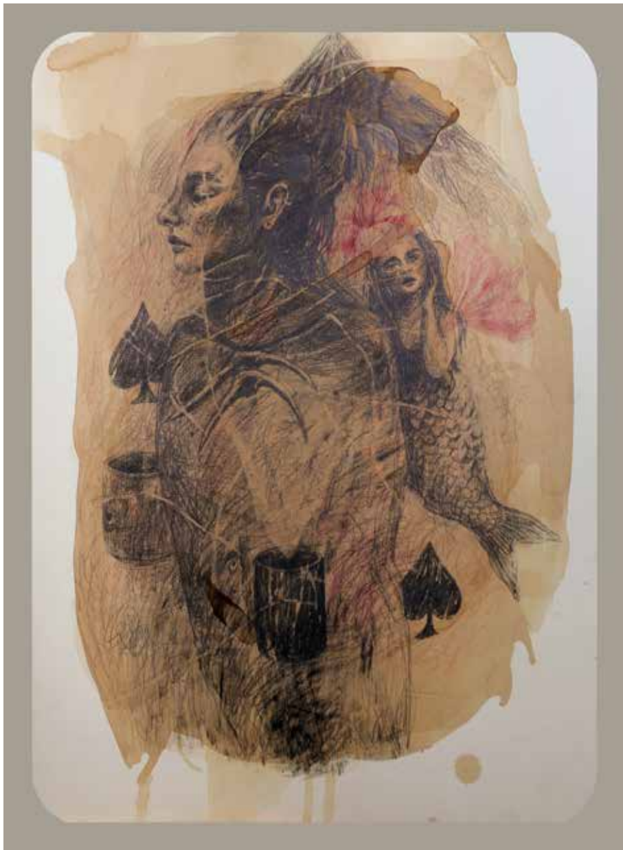
از مجموعه ملکه | ۱۳۹۷ | ترکیب مواد و مداد روی مقوا | ۷۰×۵۰ cm

From The Series Queen | 2018 | Mixed Media and Pencil on Cardboard | 70×50cm