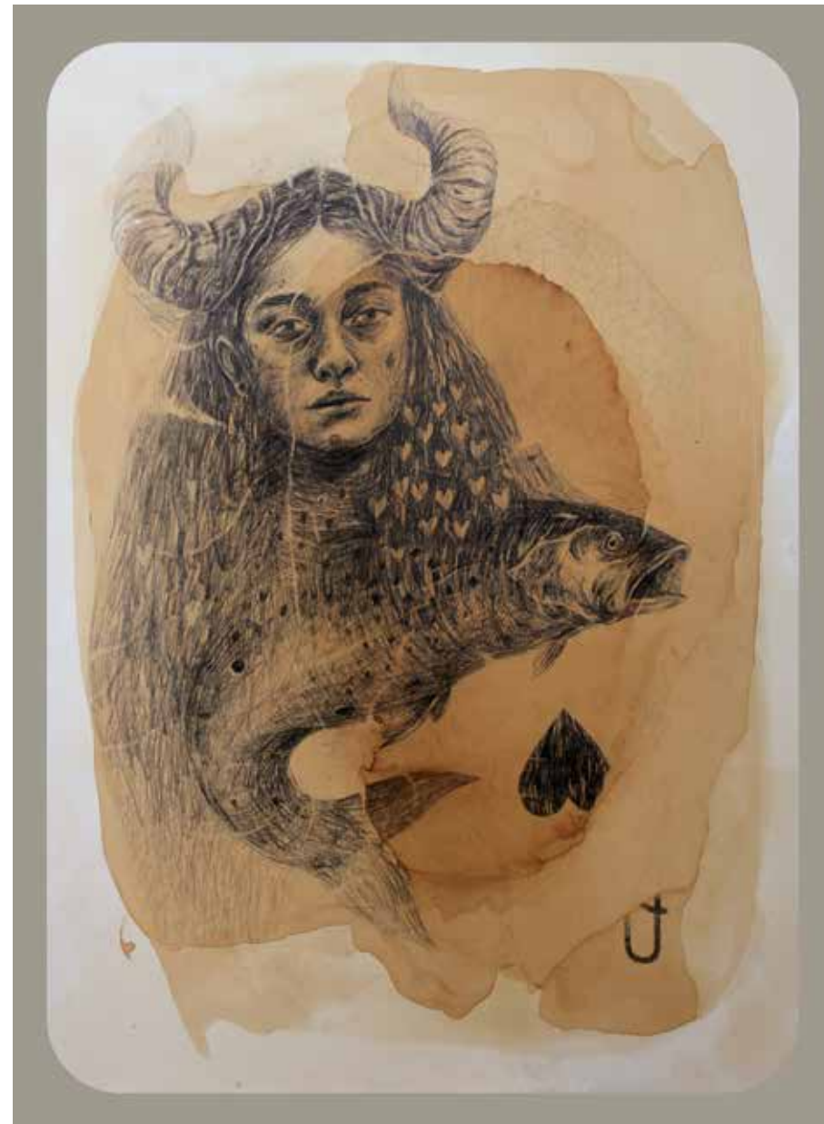
از مجموعه ملکه | ۱۳۹۷ | ترکیب مواد و مداد روی مقوا | ۷۰×۵۰ cm

From The Series Queen | 2018 | Mixed Media and Pencil on Cardboard | 70×50cm