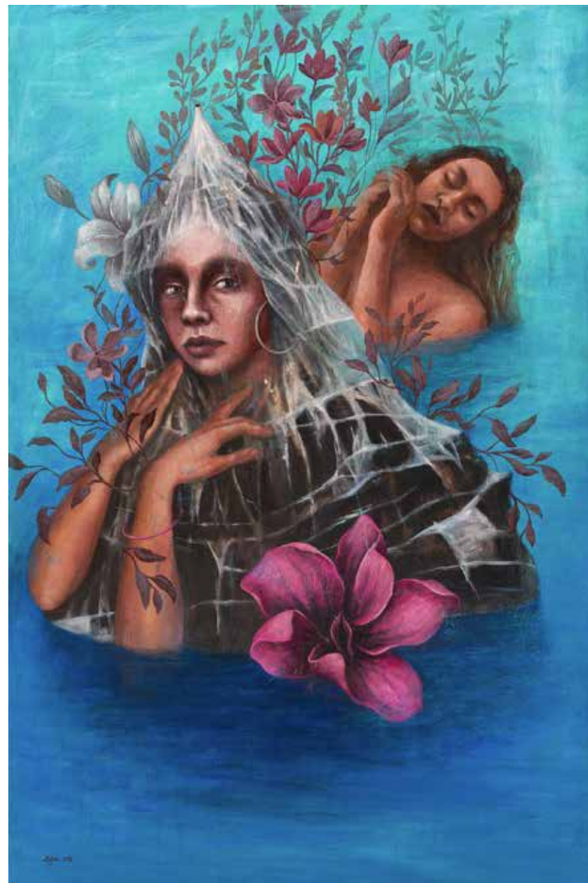
بدون عنوان | ۱۳۹۷ | اکریلیک روی بوم | ۱۲۰×۸۰cm Untitled | 2018 | Acrylic on canvas | 120×80cm