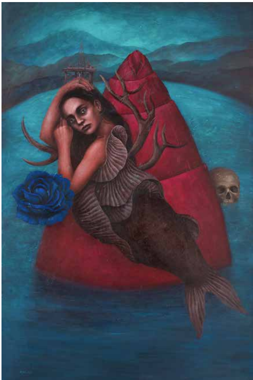
بدون عنوان | ۱۳۹۷ | اکریلیک روی بوم | ۱۵۰×۱۰۰cm Untitled | 2018 | Acrylic on canvas | 150×100cm