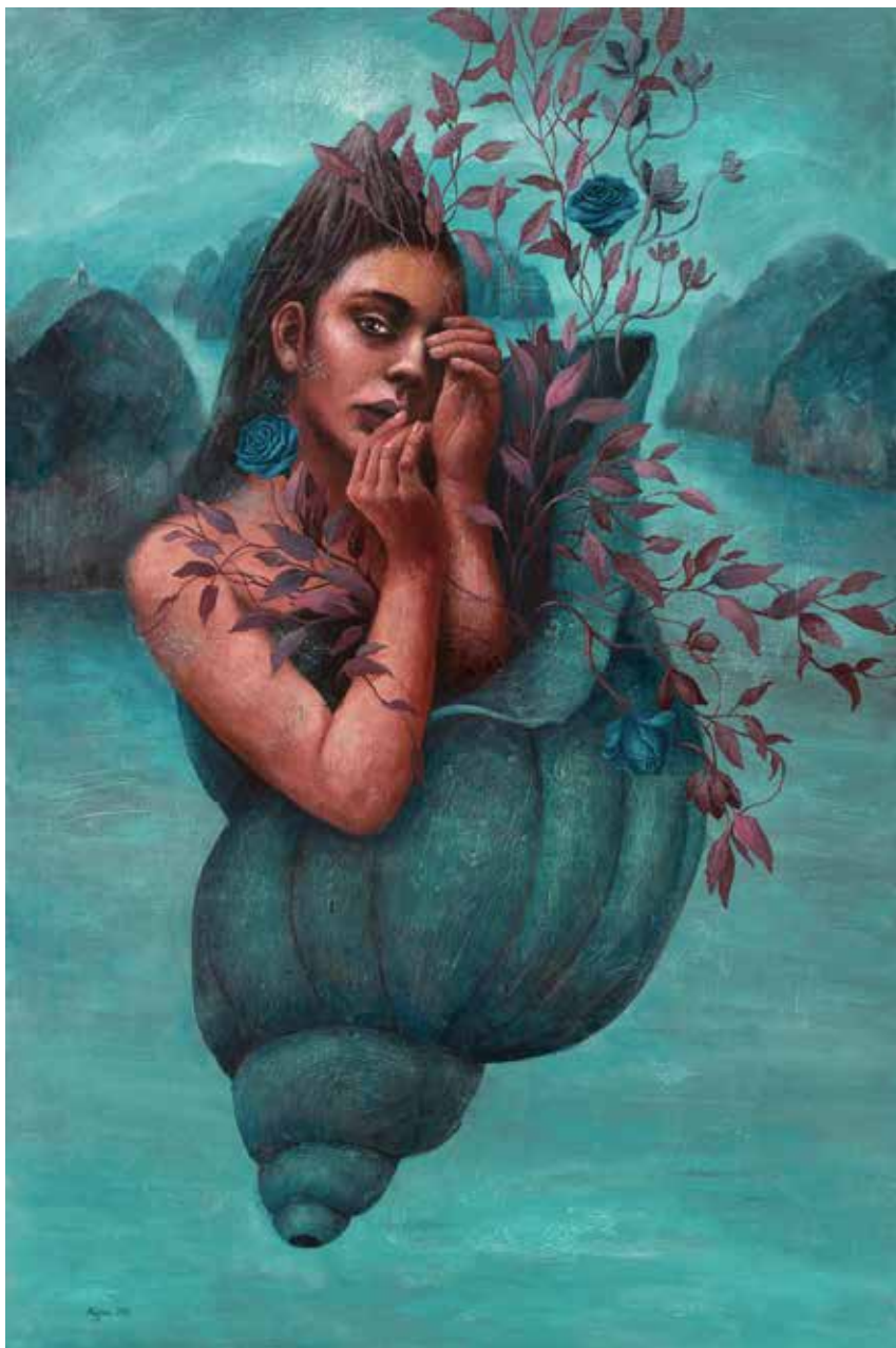
بدون عنوان | ۱۳۹۷ | اکریلیک روی بوم | ۱۲۰×۸۰cm Untitled | 2018 | Acrylic on canvas | 120×80cm