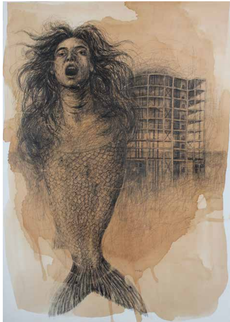
بدون عنوان | ۱۳۹۷ | ترکیب مواد و مداد روی مقوا | ۱۰۰×۷۰cm

Untitled | 2018 | Mixed Media and Pencil on Cardboard | 100×70cm